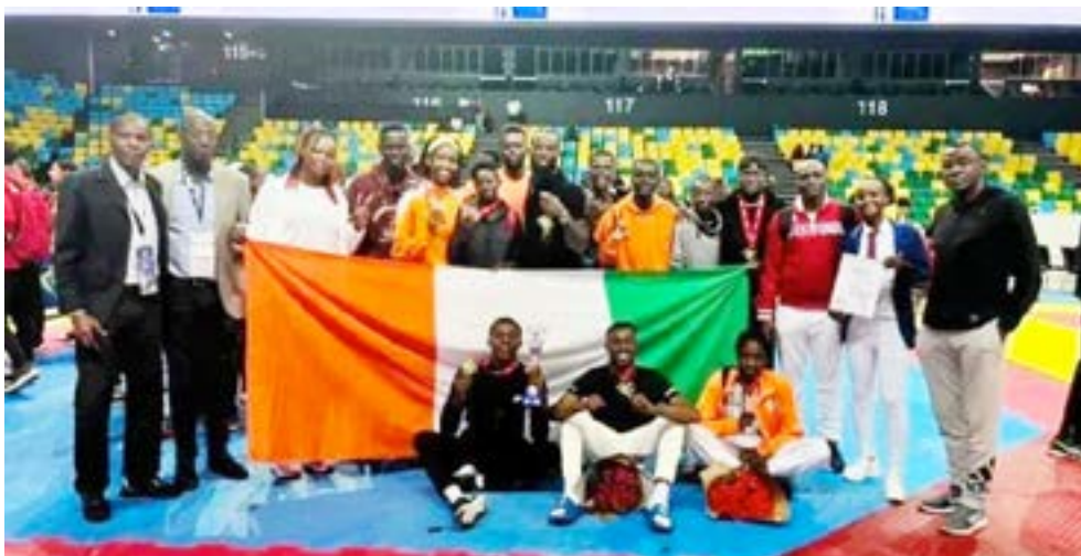
La sélection de Côte d'Ivoire de Taekwondo est rentrée de Kigali (Rwanda) avec 7 médailles aux cous.

La Côte d'Ivoire décroche 7 médailles dont 2 en or, 3 en argent et 2 en bronze. Une moisson qui permet aux ivoiriens de terminer 3 e au classement des meilleures nations de ce championnat de Taekwondo. Avec cette performance, les éléphants Taekwondo-in engrange 678 points derrière l'Égypte 749 points et le Maroc 1759 points sur 37 nations participantes. Une grande satisfaction pour les encadreurs de l'équipe ivoirienne. Ils étaient au nombre de 13, les athlètes qui sont allés défendre les couleurs de la nation. Ils se disent fiers de ces résultats. L'édition 2022 du Championnat d'Afrique des Nations senior de Taekwondo a eu lieu du 13 au 17 juillet 2022 à Kingali, la capitale Rwandaise. Elle a regroupé 36 pays dont la Côte d'Ivoire qui a pris part