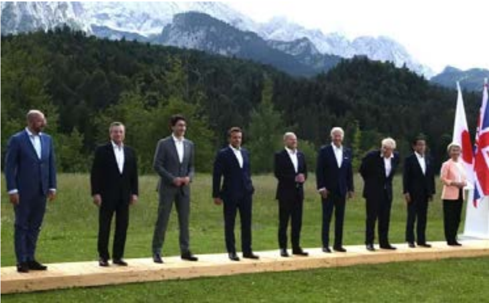
Les dirigeants du G7 (de gauche à droite) : Charles Michel (Conseil européen), Mario Draghi (Italie), Justin Trudeau (Canada), Emmanuel Macron (France), Olaf Scholz (Allemagne), Joe Biden (États-Unis), Boris Johnson (Royaume-Uni), Fumio Kishida (Japon) et Ursula von der Leyen (Commission européenne)

Une photo de famille sur fond de cimes dressées dans un ciel radieux, quelques pas dans des prés fraîchement coupés : les retrouvailles du club des sept pays industrialisés (Allemagne, États-Unis, France, Canada, Italie, Japon, Royaume-Uni) ont fourni leur lot d'images bucoliques. Mais les dirigeants se sont surtout attelés sans tarder aux priorités de ce sommet qui se tient jusqu'à mardi : la guerre en Ukraine, les menaces sur la sécurité alimentaire et énergétique, l'urgence climatique, la Chine.