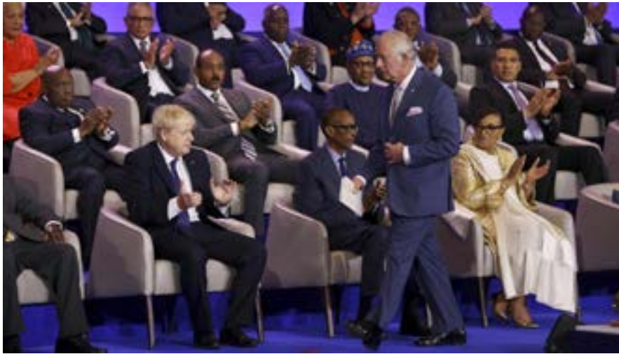
Le Gabon et le Togo ont rejoint le Commonwealth, réuni pour un sommet à Kigali, au Rwanda, le samedi 25 juin 2022

Le Gabon et le Togo, pays francophones d'Afrique de l'Ouest, sont les premiers nouveaux membres à rejoindre le Commonwealth depuis le Rwanda en 2009. Le ministre togolais des Affaires étrangères, Robert Dussey, a déclaré que l'adhésion au Commonwealth et ses 2,5 milliards de consommateurs offraient de nouvelles opportunités économiques et éducatives et suscitait un « engouement » pour l'anglais parmi ses compatriotes. « L'adhésion du Togo est motivée par le désir d'étendre son réseau diplomatique, politique et économique (...) et de se rapprocher du monde anglophone », a-t-il déclaré à l'AFP. Elle permet également à la petite nation en développement de 8,5 millions d'habitants de redéfinir les relations bilatérales avec le Royaume-Uni en dehors de l'UE après le Brexit, a-t-il ajouté. Les deux pays francophones ont également demandé leur adhésion au Commonwealth ces