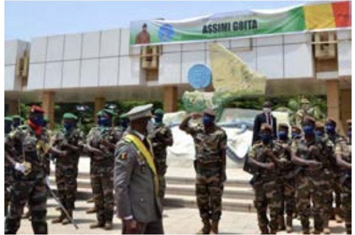
Colonel Assimi Goita président de la transition malienne

Les autorités de transition Malienne ont affirmé hier lundi avoir déjoué une tentative de coup d'État, dans la nuit du mercredi 11 au jeudi 12 mai. Selon elles, un groupuscule d'officiers et de sous-officiers anti-progressiste, soutenus par un État occidental aurait tenté un coup de force. Ces sous-officiers et officiers maliens ont été arrêtés sur le territoire national. D'autres militaires sont activement recherchés. La junte militaire, elle-même, arrivée au Pouvoir par un putsch en août 2020 qui a renversé un président démocratiquement élu, insinue un complot subversif ourdi par un État occidental qui aurait manipulé un « groupuscule d'officiers et de sous-officiers anti-progressistes ». Les faits se seraient déroulés dans la nuit du 11 au 12 Mai 2022, mais n'ont été révélées qu'hier par les autorités maliennes qui fustigent un « dessein malsain » visant à briser la dynamique de la Refondation du Mali. « La tentative a été déjouée grâce à la vigilance et au professionnalisme des Forces de Défense et de Sécurité du Mali », selon le communiqué du Gouvernement du Mali.