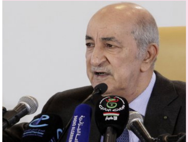
Le nouveau Président Algérien

Le président algérien, Abdelmadjid Tebboune, élu à 58,13% des voix au 1er tour de la présidentielle le 12 décembre, prend ses fonctions ce jeudi pour un mandat de cinq ans. Il prête serment lors d'une cérémonie publique à Alger. M. Tebboune succède à Abdelaziz Bouteflika, contraint à la démission en avril dernier, après 20 ans à la tête de l'État,